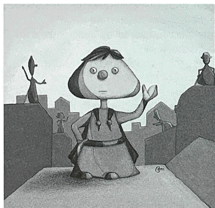
illustration : Patrick Martel

Un petit garçon habite le village de Pasperdus. C'est Aurélien Boniface et il vit avec son père et sa grand-mère. De sa mère décédée, il ne sait pas grand chose. Aujourd'hui, Aurélien fait les 400 coups : il se sauve de l'école, achète des saucisses au lieu du steak haché et, enfin, il ne rentre pas souper.